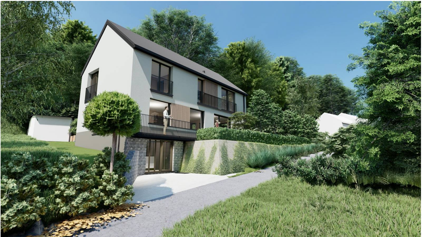
Vue 2 : Vue depuis le haut du Sentier des Monts