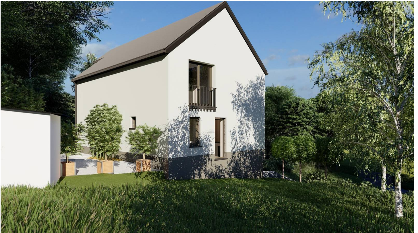
Vue 6 : Vue aérienne de la façade ouest