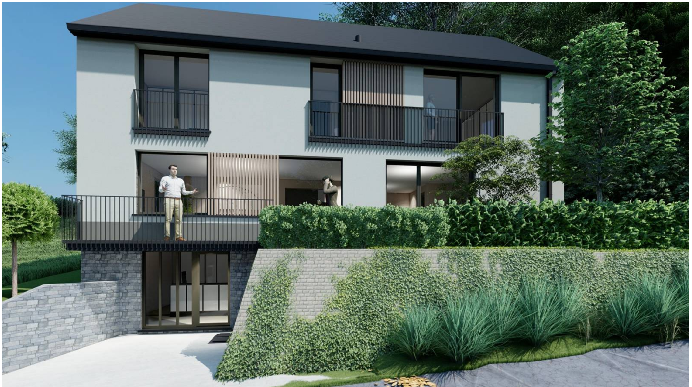
Vue 4 : Vue depuis le fond du jardin (Façade arrière sud)